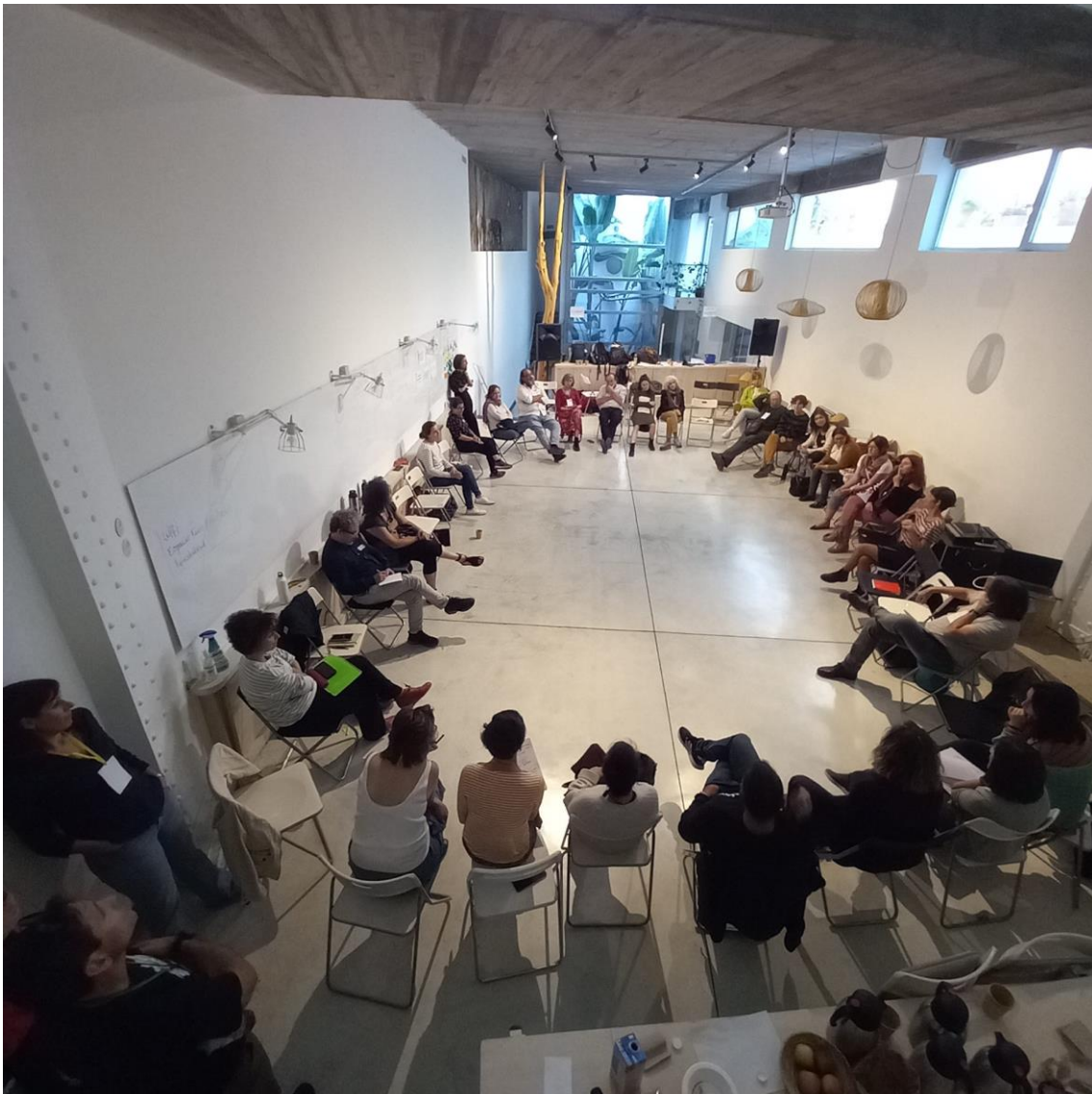
Imagen 3. Espacio de plenario del Encuentro Universidad Crítica Transformadora.

Red para multiplicar y compartir: otra de las reflexiones clave del tablón giró en torno a cómo se producirá este cambio. Una gran parte del profesorado animó a tejer vínculos entre docentes, universidades y colectivos para generar estas sinergias desde procesos más horizontales y participativos. Se mencionó que la transformación de la Universidad es posible, pero desde el trabajo en red. Además, se consideraron necesarias nuevas formas de construir lo común, involucrando a toda la comunidad universitaria: “los intercambios (Sur-Norte, Universidad-Sociedad) son necesarios para reorientar nuestro actuar. ¡Tenemos que buscar sinergias transformadoras!”