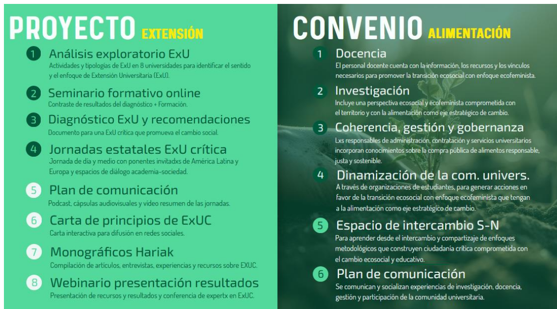
Imagen 1. Actividades principales del proyecto (izq.) y líneas de trabajo del convenio (dcha.).

Su objetivo es reforzar el compromiso y potencial transformador de la Universidad en la construcción de modelos agroalimentarios que tengan en cuenta la emergencia climática desde la perspectiva de la educación crítica y transformadora, desde los feminismos y la justicia social. La coherencia entre la teoría y la práctica es esencial en procesos de aprendizaje que persigan una transformación social real, por lo que este convenio aspira a hacer confluir iniciativas de cambio desde la docencia, la investigación, la extensión e incluso desde la compra pública de la propia universidad. Para todo ello, hemos querido contar con universidades latinoamericanas de larga trayectoria en la movilización social que nos acompañarán y darán apoyo durante todo el proceso. Más información aquí .